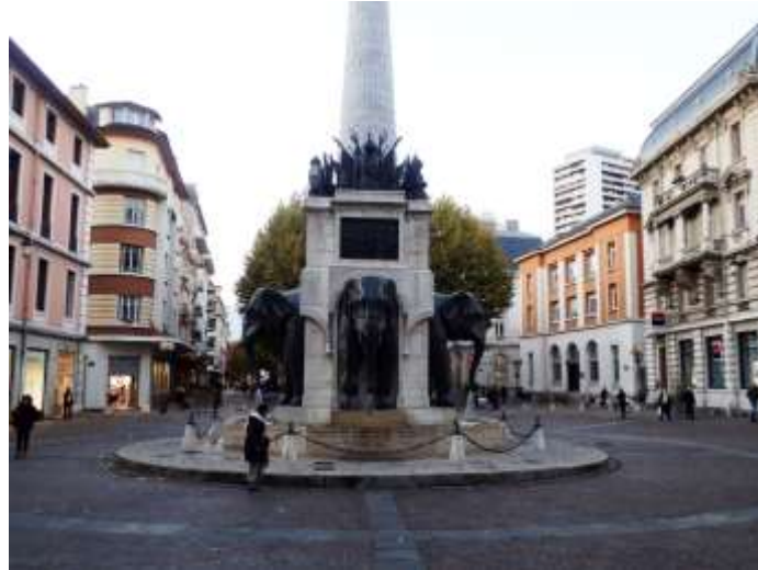
Chambéry, Fontaine des Eléphants

CHAMBERY Salle Cœur de Mérande (voir plan de situation)