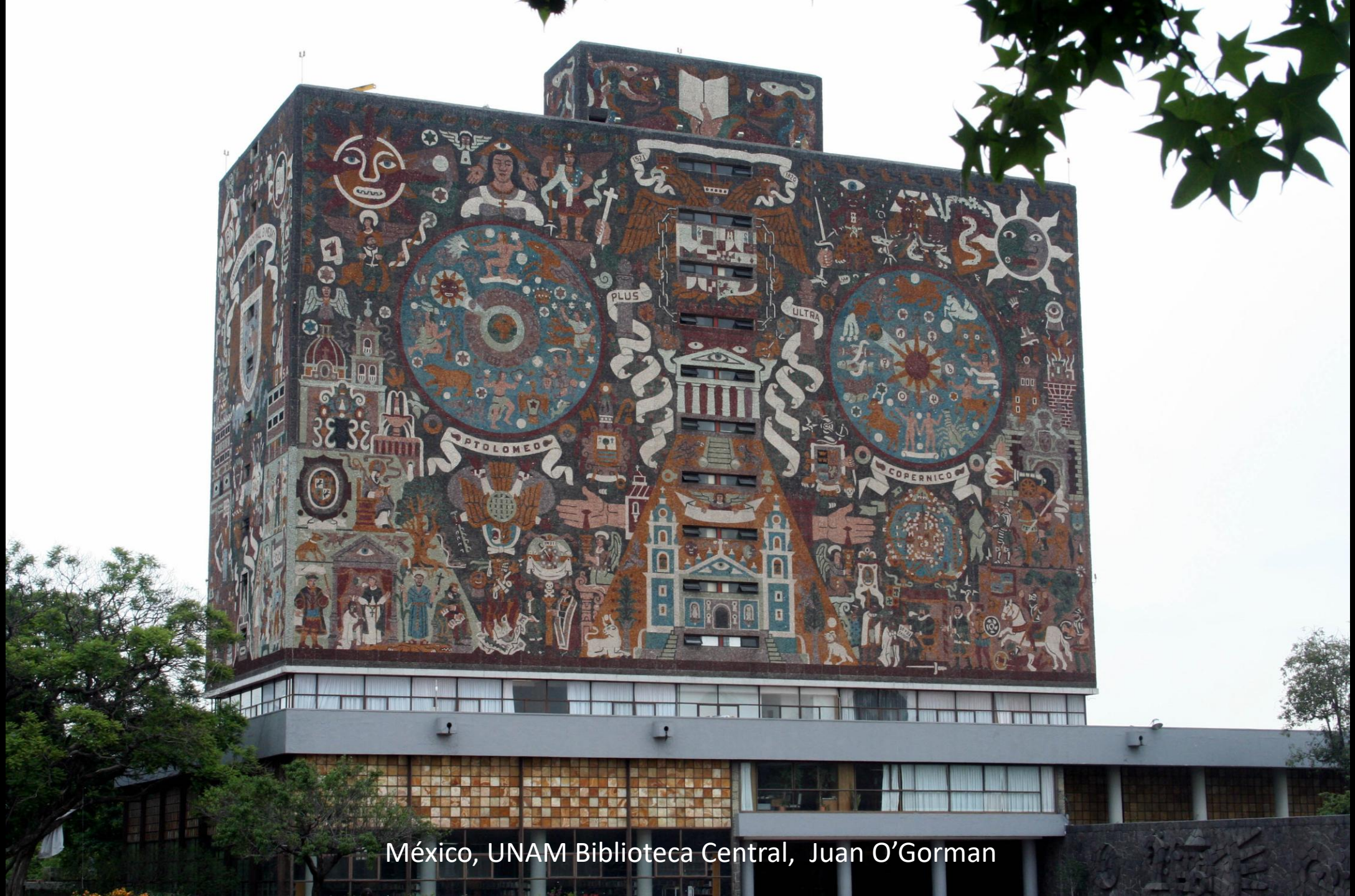
México, UNAM Biblioteca Central, Juan O'Gorman