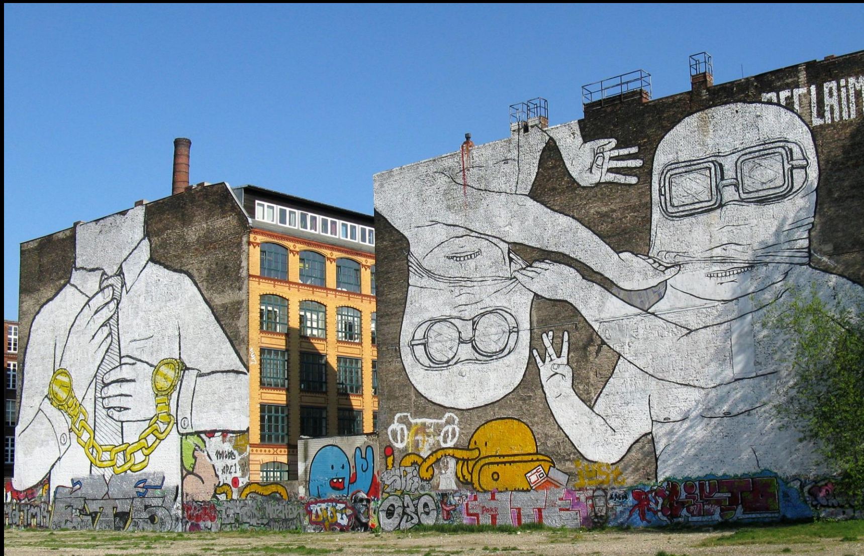
Blu Berlin, Kreuzberg - curvystrasse