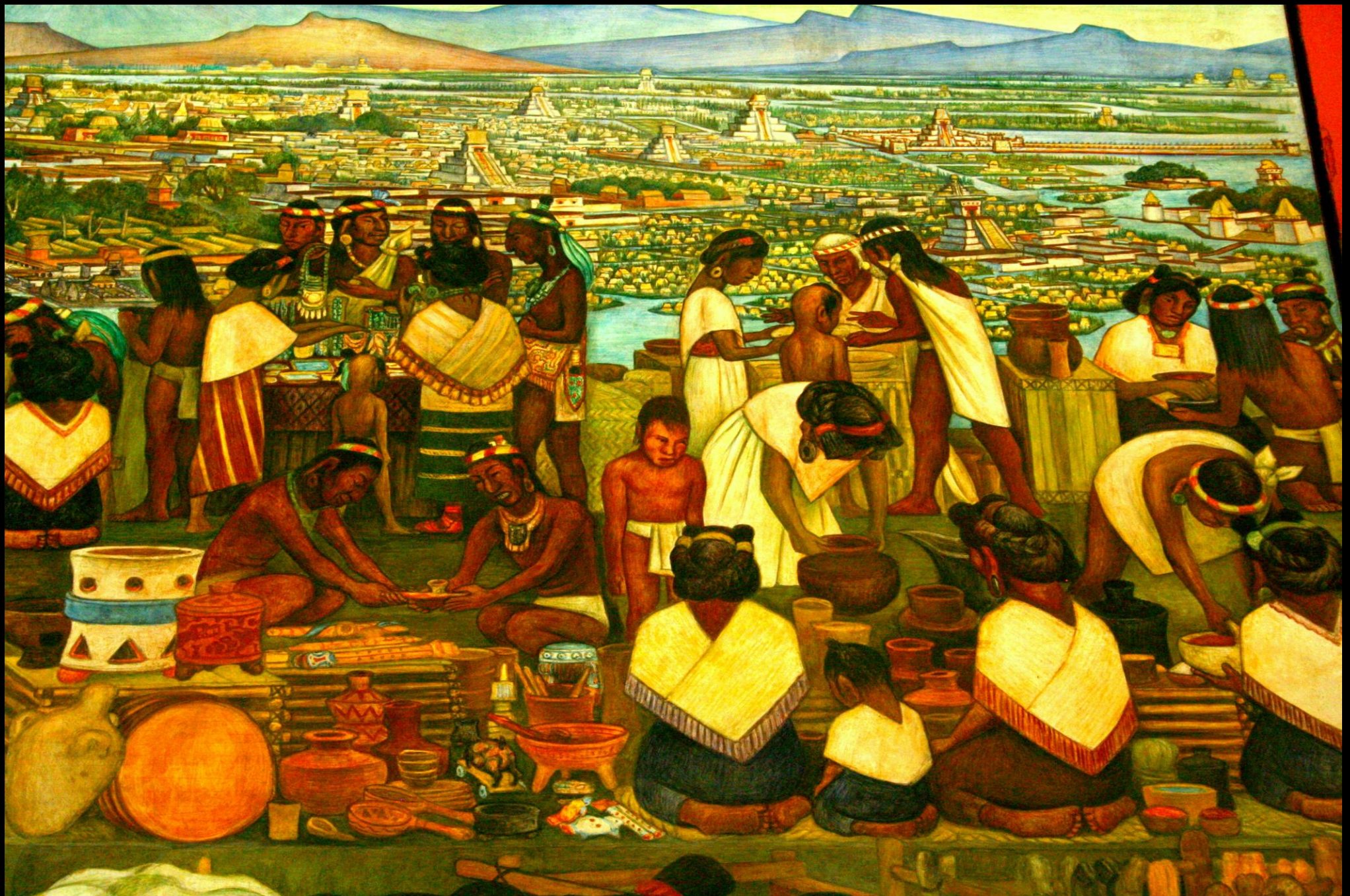
Diego Rivera, Palacio nacional