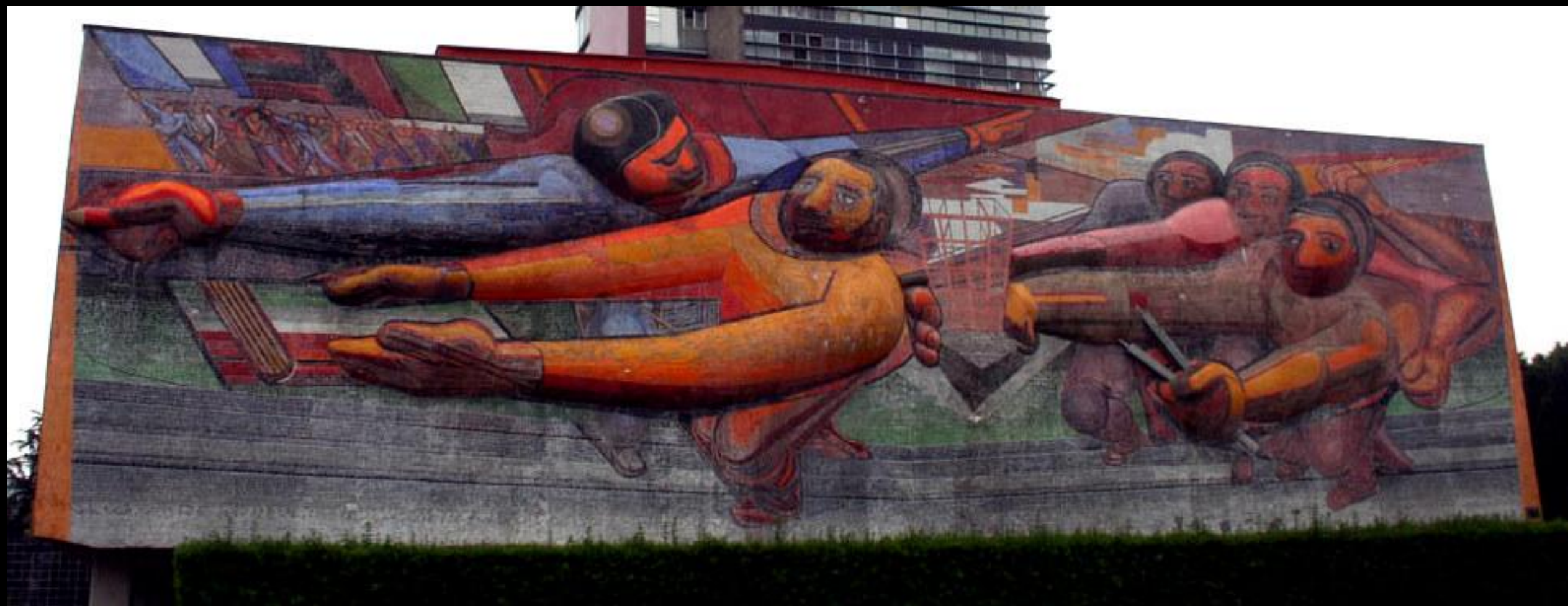
David Alfaro Siqueiros, UNAM Rectoría