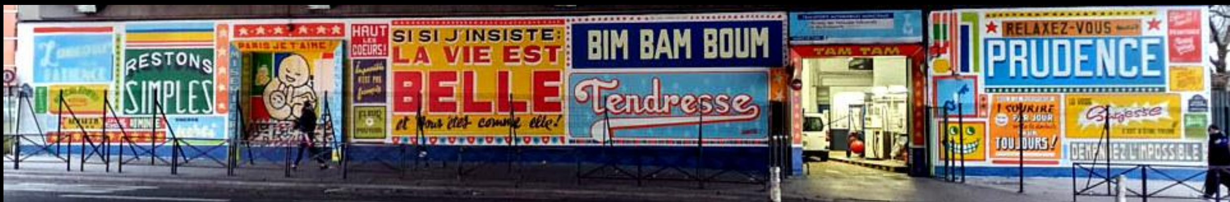
Toqué Frères – Saint-Denis et Paris Porte de Saint-Ouen