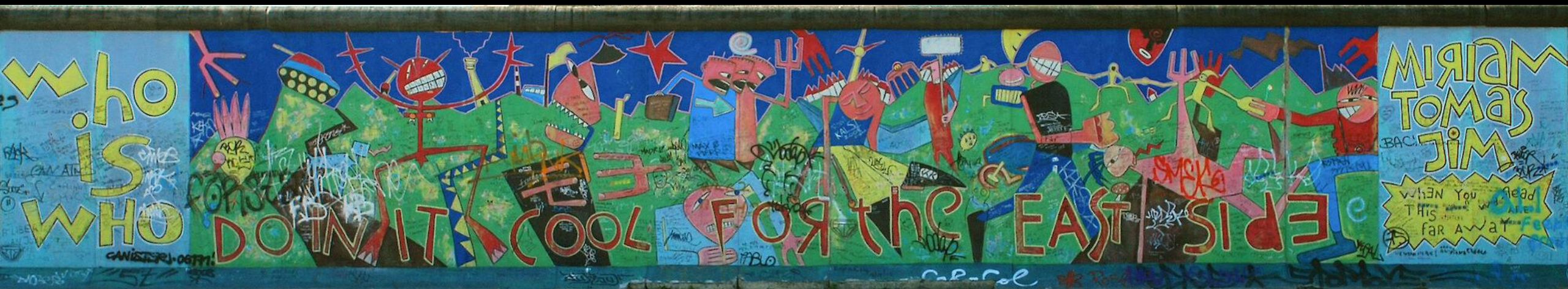
Jim Avignon et autres — « Doin' it cool for the East Side » - Version originale, 1990