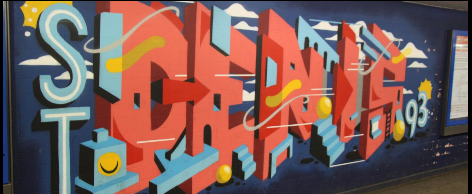
Gare SNCF Saint-Denis