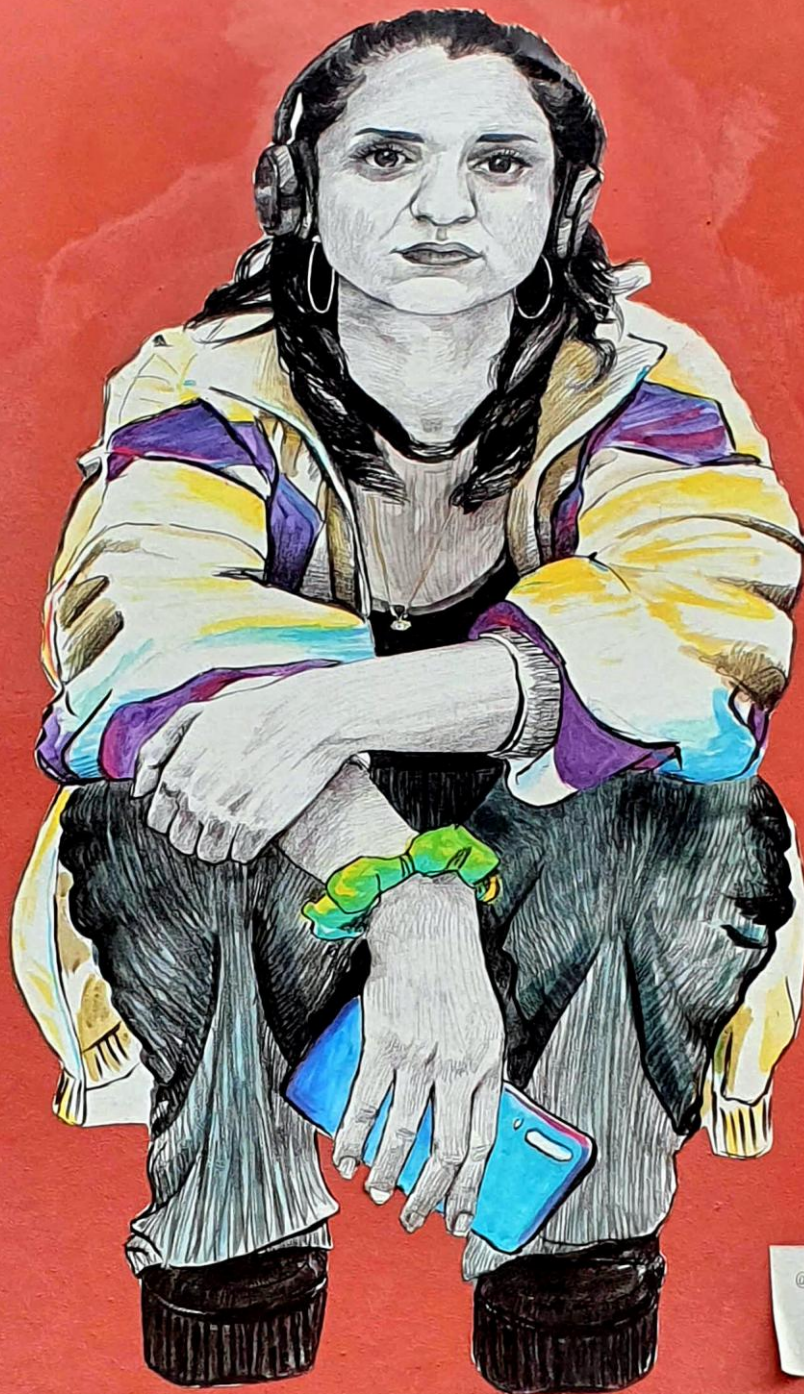
La Dame qui Colle – Gardiennes de rue , Lille 2022

@LaDame_QUICOLLE Portrait.2, #gardiennesderue Impressions sur dos bleu, collage, 60x100cm ou comment réintroduire les femmes dans la ville