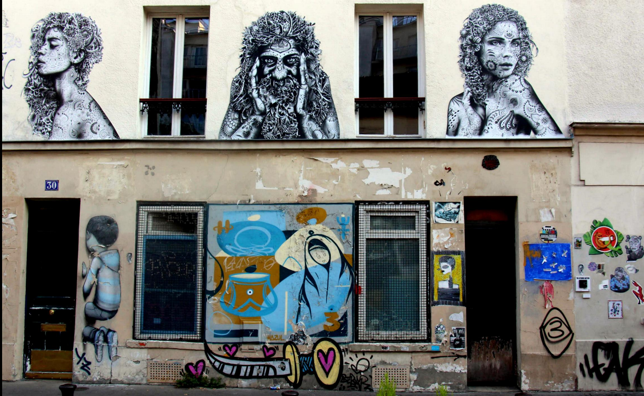
Paris 13 ème , rue de la Butte-aux-Cailles – Aydar, Seth, Hazul, Louyz, etc.