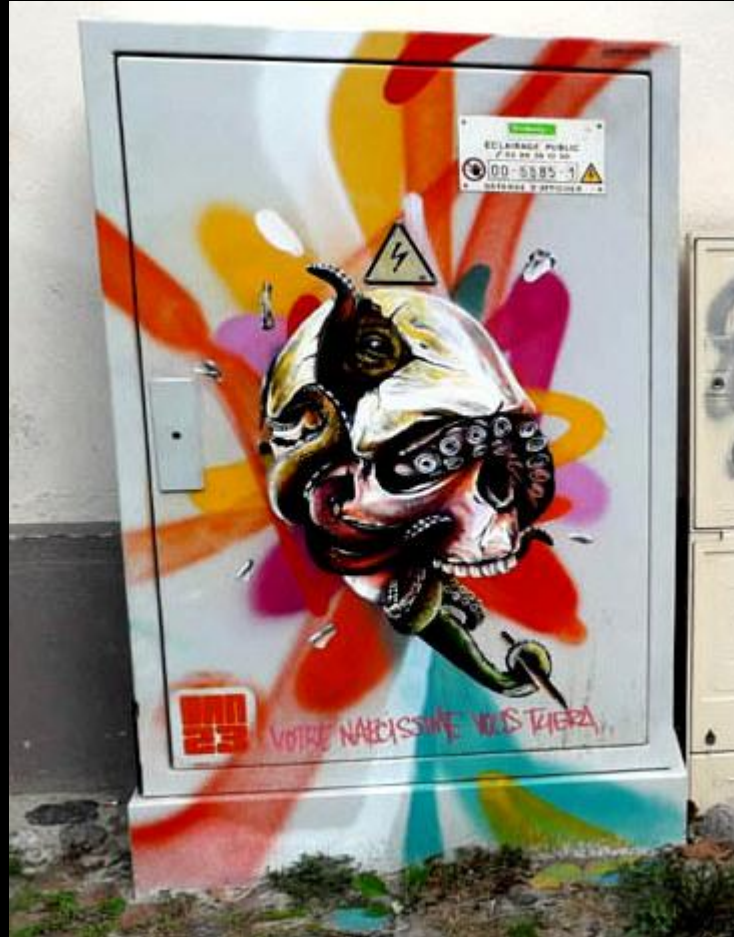
Dan 23 - Strasbourg