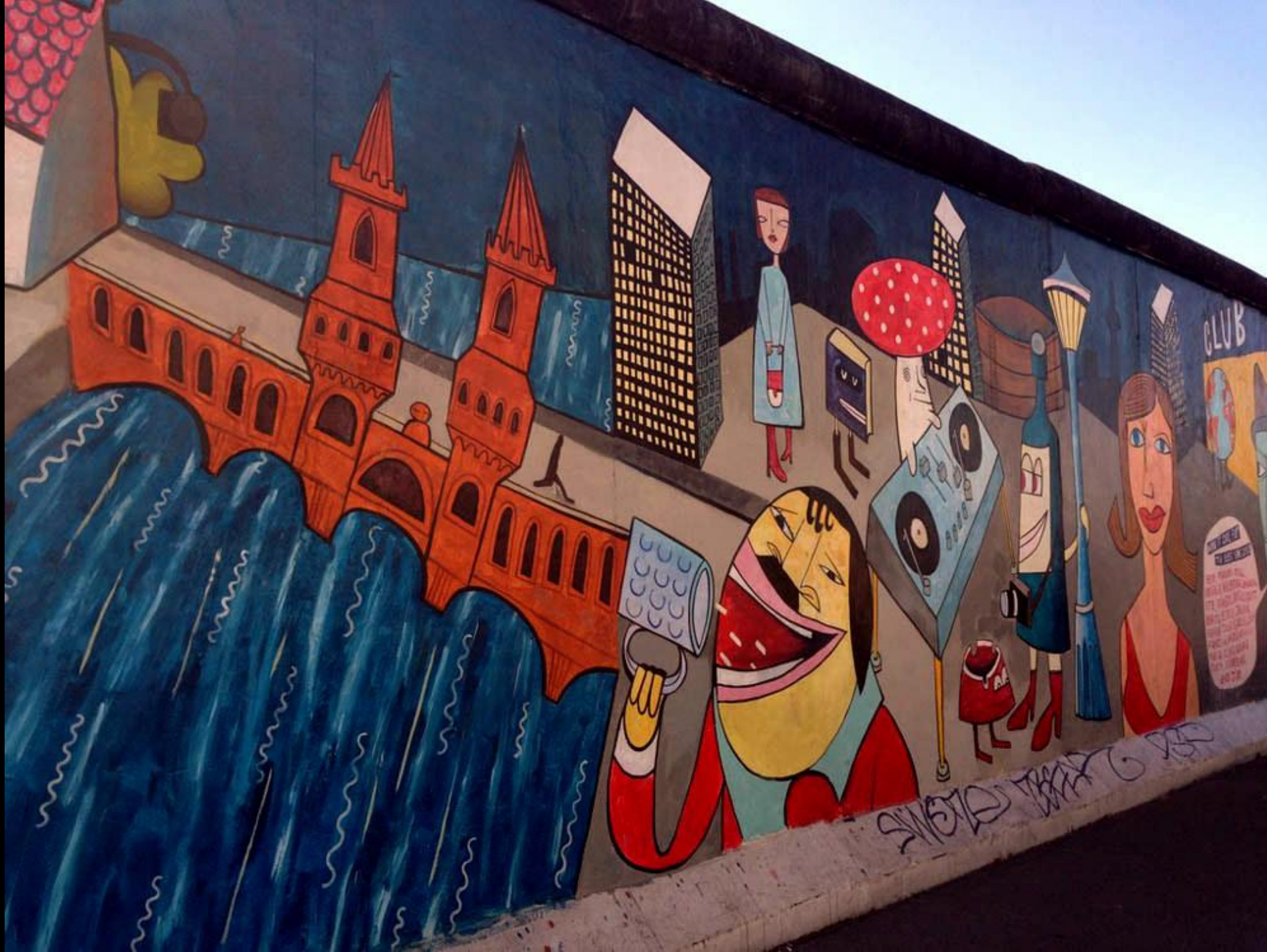
Jim Avignon et autres – « Doin it cool for the East Side » - Version 2013